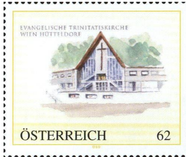
Briefmarke der Österreichischen Staatsdruckerei, herausgegeben 2012

Der Pfarrer leitet die Pfarrgemeindegemeinschaft mit einer engagierten Schar von Mitarbeiterinnen und Mitarbeitern.